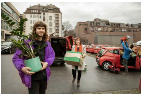
Sharing-Fahrzeuge: Fuhrpark von Sharing-Fahrzeugen