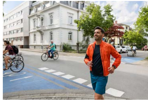
Lebendige & verkehrsberuhigte Ortsmitten: Umgebaute Innenstadt/gemischtes Wohngebiet