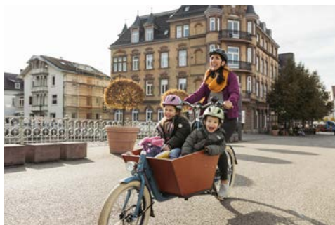
Lastenrad: Lastenrad mit Kindern