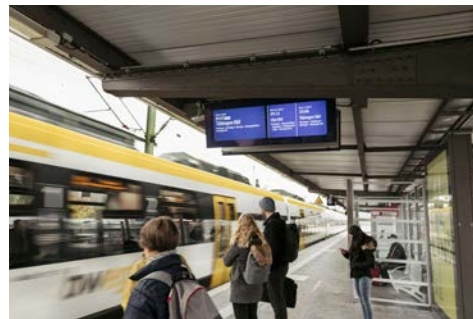
Digitale Mobilitätsinformationen: Echtzeitanzeiger am Bahnhof