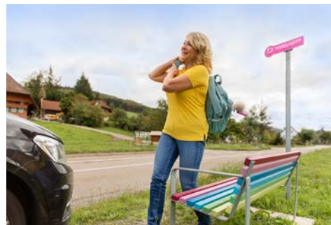
Mobilität im ländlichen Raum: Mitfahrbänke