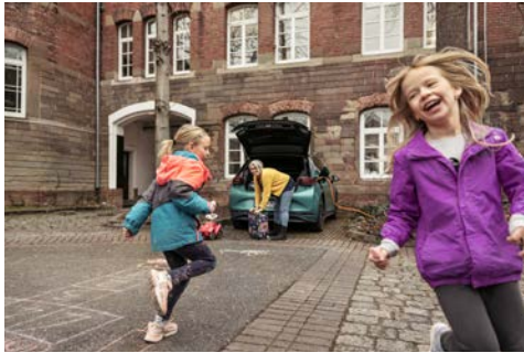
Elektrische Fahrzeuge beim Laden (im privaten Bereich): Familie

Aktuell stehen folgende Motive zum Download und zur Nutzung zur Verfügung: