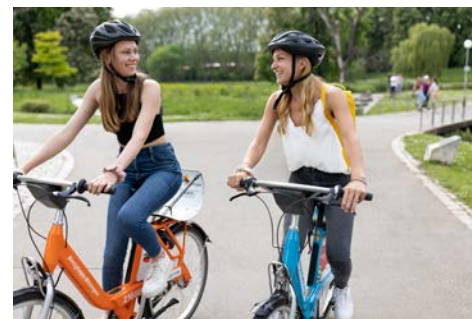
Sharing-Fahrzeuge: Ausflug mit Sharing-Rädern