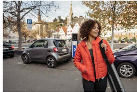
Elektrische Fahrzeuge beim Laden (im privaten Bereich): Parkplatz-Vorteil in der Stadt