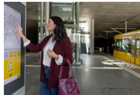
Digitale Mobilitätsinformationen: Verkehrsinformationen am Bahnhof