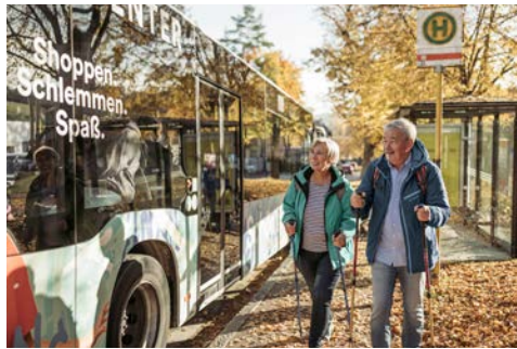
Mobilität im ländlichen Raum: Öffentlicher Bus auf dem Land

Aktuell stehen folgende Motive zum Download und zur Nutzung zur Verfügung: