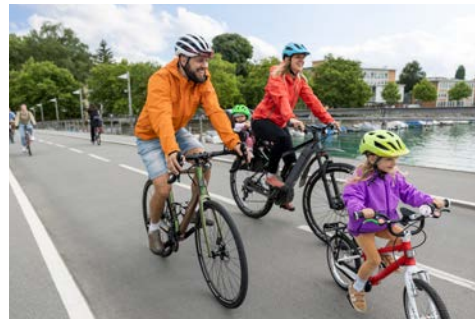
Umgebaute Straßenräume mit Vorrang für Radfahrer:innen und Fußgänger:innen: Fahrradbrücke