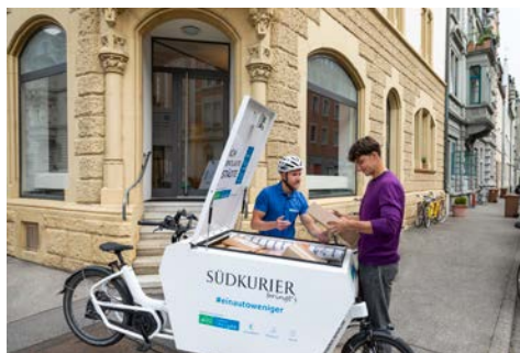
Lastenrad: Lastenrad gewerblicher Lieferverkehr