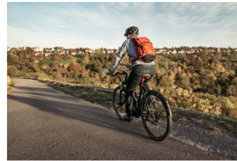
Mobilität im ländlichen Raum: Pendeln mit dem Fahrrad