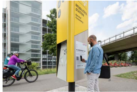
Mobilitätsstationen: Mobilitätssäule am Bahnhof