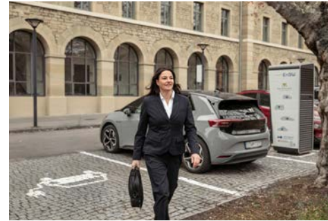
Elektrische Fahrzeuge beim Laden (im beruflichen Kontext)