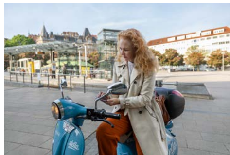
Sharing-Fahrzeuge: Ausleihvorgang E-Roller