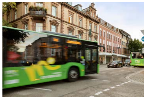
Zeitgewinn durch Nutzung öffentlicher Verkehrsmittel: Busspur im Berufsverkehr