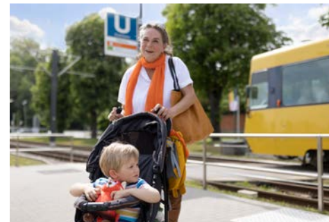
Zeitgewinn durch Nutzung öffentlicher Verkehrsmittel: Zeit mit Kindern