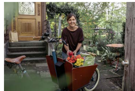
Lastenrad: Einkauf bis vor die Haustür