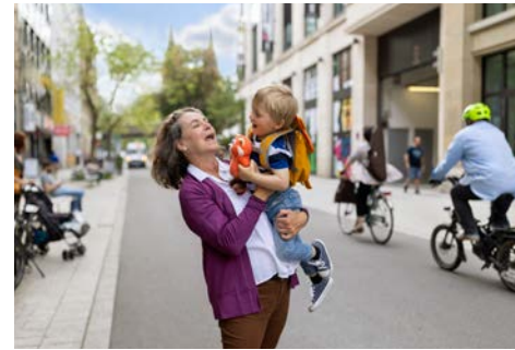
Lebendige & verkehrsberuhigte Ortsmitten: Miteinander von verschiedenen Verkehrsteilnehmer:innen