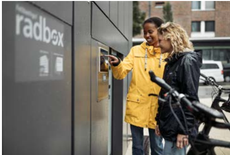
Fahrradparkhaus: Radabstellanlage mit Zugangssicherung

Aktuell stehen folgende Motive zum Download und zur Nutzung zur Verfügung: