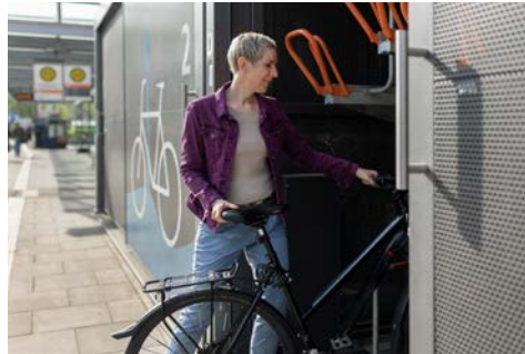
Fahrradparkhaus: Fahrradbox in der Stadt