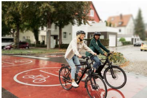
Umgebaute Straßenräume mit Vorrang für Radfahrer:innen und Fußgänger:innen: Fahrradstraße