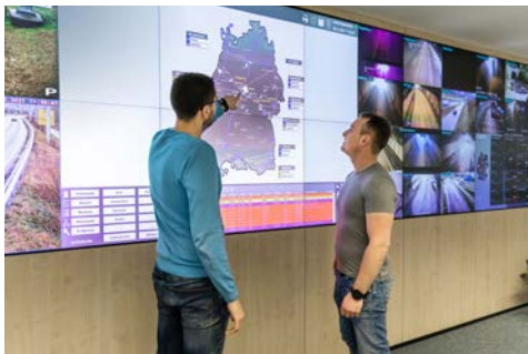
Digitale Mobilitätsinformationen: Informationsaustausch in der Verkehrsleitzentrale